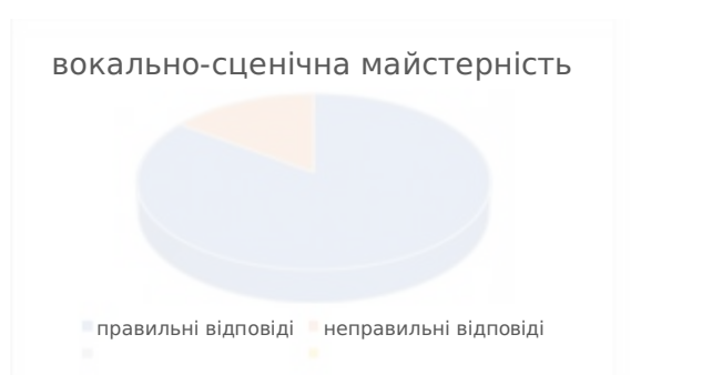
Рис. 2.1. Результати відповідей на питання №1

Під час бесіди на перше запитання про «вокально-сценічну майстерність» більшість студентів (17) не надали правильної відповіді, проте кілька студентів (3) визначили її як «складову фахової майстерності, що включає в себе знання, уміння та навички у виконавському мистецтві, включаючи сценічне втілення, виразність жестів та вокальних інтонацій» (рис. 1).