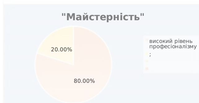
Рис. 2.2. Результати відповідей на питання №2

На друге запитання про сутність поняття «майстерність» більшість студентів (16) відповіла, що це «високий рівень професіоналізму» або «досконале володіння в певній справі, вправність та висока якість виконаної роботи» (рис. 2.2.).