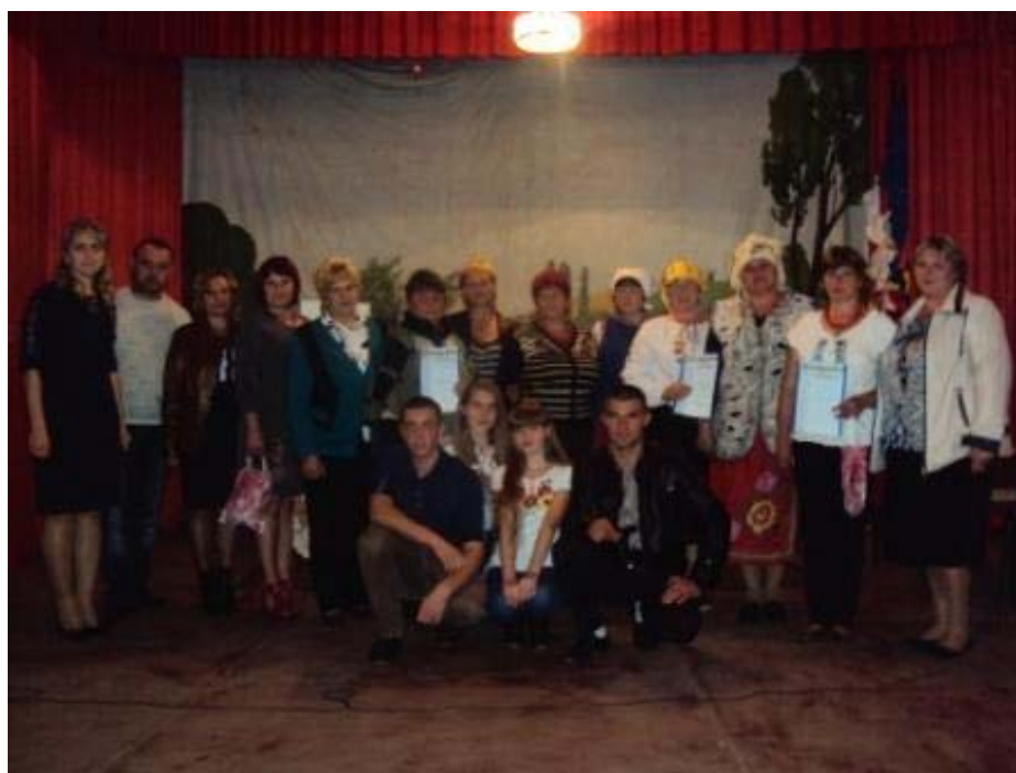
Фото 4. Учасники 46–го Всеукраїнського фестивалю театралізованого мистецтва «Вересневі самоцвіти».