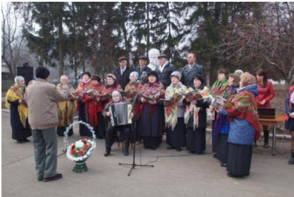
Фото 1. Виступ народного аматорського хору ветеранів при Голованівському районному Будинку культури з нагоди вшанування пам'яті Тараса Григоровича Шевченка.

Фото з концертної діяльності митців Голованівського району