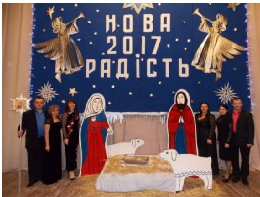
Фото 3. Учасники V Регіонального різдвяного фестивалю народної творчості «Нова радість» (м. Гайворон Голованівського району Кіровоградської області, районний Будинок культури) – артисти – співаки Голованівського районного Будинку культури.